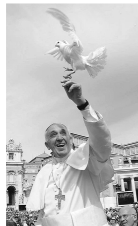
Dans Compendium CEC.

Dans la célébration sacramentelle, gestes et paroles sont étroitement liés. En effet, même si les gestes symboliques sont déjà en eux-mêmes un langage, il est pourtant nécessaire que les paroles rituelles les accompagnent et les vivifient. Inséparables à la fois comme signes et enseignement, les paroles et les gestes liturgiques le sont aussi parce qu'ils réalisent ce qu'ils signifient.