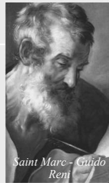
Saint Marc - Guido Reni

m'a consacré par l'onction. Il m'a envoyé porter la Bonne Nouvelle aux pauvres, annoncer aux captifs leur libération, et aux aveugles qu'ils retrouveront la vue, remettre en liberté les opprimés, annoncer une année favorable accordée par le Seigneur. » Jésus ferma le livre, le rendit au serviteur et s'assit. Tous, dans la synagogue, avaient les yeux fixés sur lui. Alors il se mit à leur dire : « Aujourd'hui s'accomplit ce passage de l'Écriture que vous venez d'entendre. »