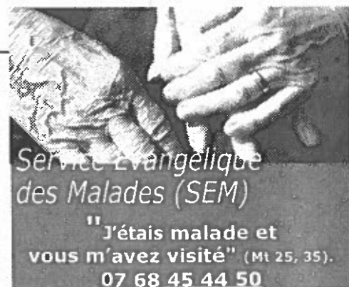
Service évangélique des Malades (SEM)

Comble l'espérance de ceux qui sont morts : par le baptême de l'eau et du feu, qu'ils parviennent aux rives de la vraie vie.